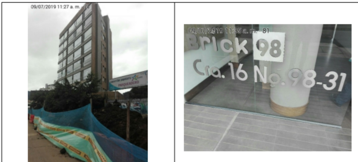
Foto 1. Vista panorámica del predio, donde se encontraba instalado el elemento en la Carrera 16 No. 98-31.