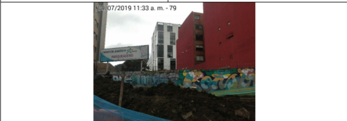
Foto 3. Vista panorámica del predio contiguo, donde será trasladado e instalado el elemento y registro, en la Carrera 16 No. 98-05 (Dirección Catastral), orientación Norte-Sur.